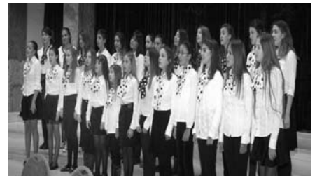
Otroški zbor RTS, 2013