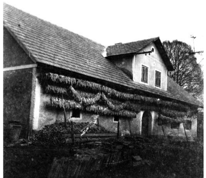
Družinska hiša, Lipca, Škofja Loka (1962)

Do hiše se je prišlo po stezici, ki se je ločila od asfaltne ceste. Peljela je ob gozdu, dokler se ni blago spustila proti dolini. Tu so se na vsaki strani razprostirala polja, tik ob stezi so bila neenakomerno posajena stara jabolka. V bližini je bil kozolec, na katerem so bili zloženi snopi žita. Levo od hiše je stal hlev s