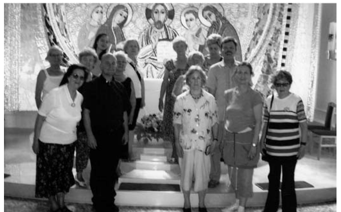
V cerkvi Zaplaz, 22. 06. 2013 Šentvid