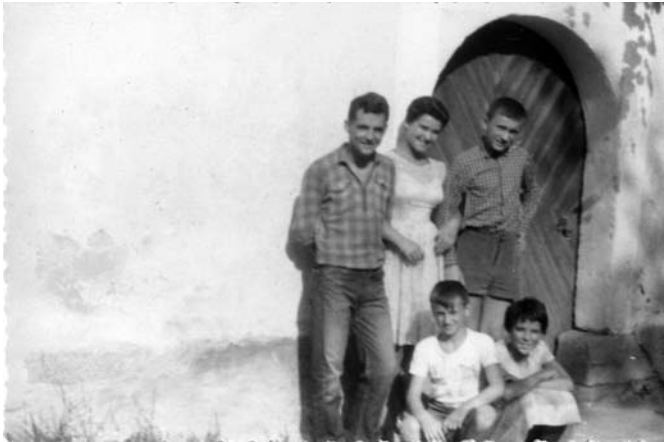
S sorodniki, Lipca (okoli leta 1960)

Leta neusmiljeno tečejo. Pogosto se v tej naglici borimo, da bi ohranili v spominu tisto, za kar mislimo, da je najvredneje, najpomembneje, kar določa ali je določalo življenja naših prednikov, naša življenja. In kar mislimo, da je potrebno vgraditi v življenja naših naslednikov.