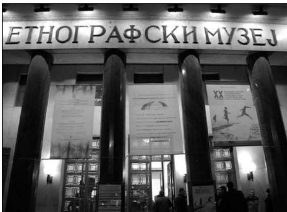
Sl. 1 Slovenska noša; sl. 2 Etnografski muzej v Beogradu; sl. 3. Cerkev Sv. Antuna v Beogradu