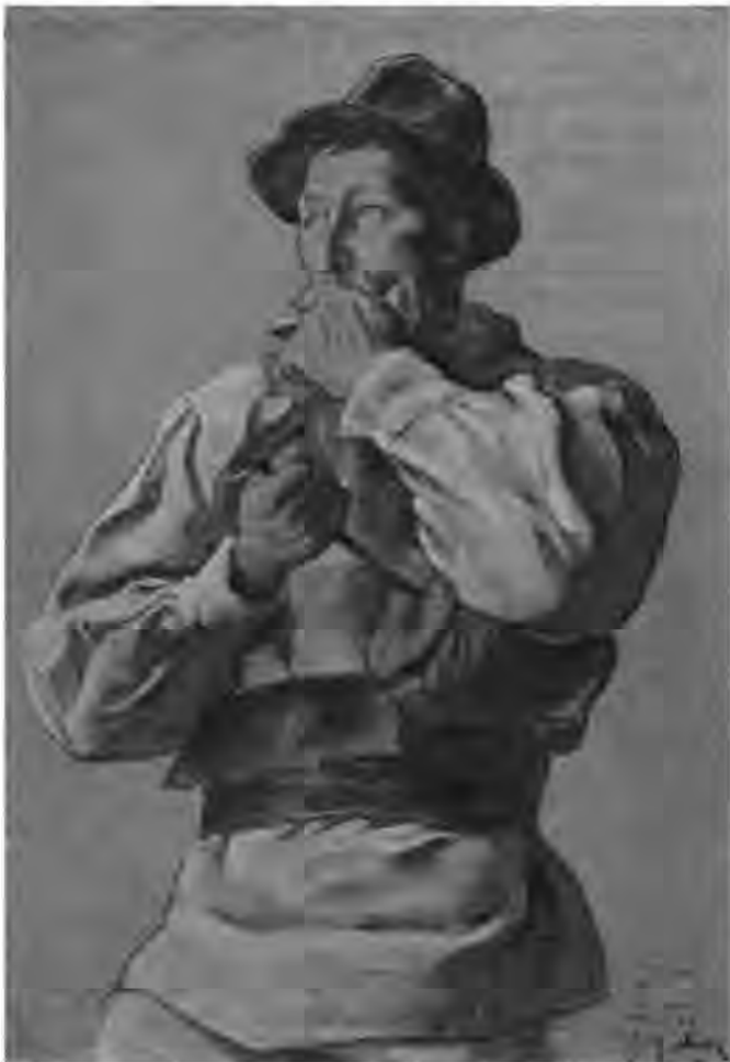
Božidar Jakac (1899-1989)

Pri društvih in tudi priseljenskih za arhivsko gradivo lahko na osnovi takšnega vrednotenja označimo naslednje kategorije dokumentarnega gradiva: gradivo, ki dokazuje pravni status društev, registracija, prenehanje delovanja, preimenovanja,