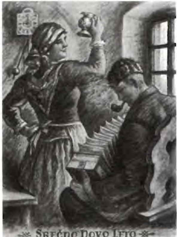
Maksim Gaspari (1883-1980), Srečno novo leto