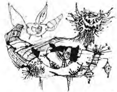
F. Mihelič; Risba

Menimo, da je način pridobitve državljanstva po rodu, ki ga v svoji pristni obliki poznajo številne države v svetu, v Slovenski zakonodaji popolnoma modificiran s predpogoji, kot so državljanstvo staršev, ali naselitev v Republiki Sloveniji. Kaj narediti v primerih ko starši slovenskega rodu niso doživeli osamosvojitve Slovenije? Prav tako predpogoj in obveza, da novi državljani mora živeti v Sloveniji praktično pomeni, da slovenski rod - druge in tretje generacije - mora (po zakonu) odumreti. Menimo, da to vsekakor ni nacionalni interes Slovenije. Veliko število Slovencev se čuti odvrženo s strani matice, ki jih ni podprla v pomembnem trenutku. V pogojih izjemne revščine, v kateri živi veliko število naših članov, bi bilo nesprejemljivo, da z napačno oceno zmanjšamo nekogaršnjo možnost za pridobitev slovenskega državljanstva.