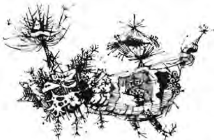
F. Mihelič; Risba

Vsem nam je dobro znana RESOLUCIJA O STRATEGIJI NACIONALNE VARNOSTI REPUBLIKE SLOVENIJE (ReSNV), sprejeta 21.06.2001, ki ugotavlja da: "Trajna, življenjsko pomembna interesa Republike Slovenije sta ohranitev nacionalne identitete in samobitnosti slovenskega naroda. tako znotraj meja Slovenije kot v zamejstvu in po svetu.". Po sprejetju RESOLUCIJE O ODNOSIH S SLOVENCMI PO SVETU