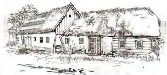
F. Mihelič: Bajta, 1934