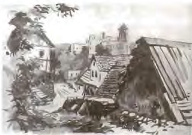
F. Mihelič: Zuzemberk, 1947

Kazor, kjer je na kratko posijalo sonce in Planjo, čisto v oblakih. Pri vzponu smo uživali ob pogledu na celo čredo gamsov z nemirnimi mladiči. Za eno večjo skalo, le kakšnih 20 m stran se je prikazal mogočen samec z velikimi rogovi. Ni se oziral po nas temveč je brez naporov odkorakal v višino, mi pa smo za njim počasi sopihali, čisto prepoteni.