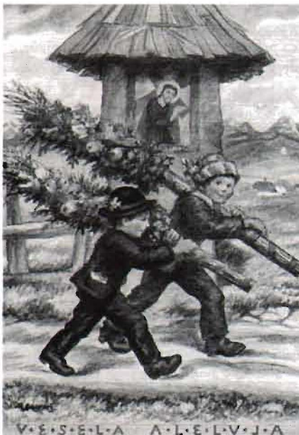
Maksim Gaspari Vesela Aleluja

Razvlečeno testo, pripravljeno po receptu za vlečno testo z začetka priloge, ki mu porežemo debele robove, namažemo z nadevom; če je nadev bolj redek, ga potresemo še z drobtinami ali zdrobom in zvijemo v klobaso. Zvitek prevalimo na ožet, z drobtinami potresen prt, povežemo z vrstico in počasi kuhamo v slanem kropu 1/2 ure. Kuhane štruklje pustimo na mizi nekaj minut, nato jih odvijemo, zrežemo na rezine in zabelimo s prepraženimi drobtinami. Slane skutne