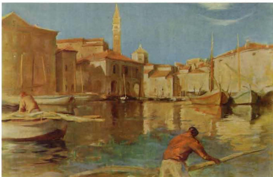
Božidar Jakac: Piran, 1947.

razume telo, ki zastopa interese in predstavlja nacionalno manjšino na področju uradne rabe jezika, izobraževanja, informiranja v jeziku nacionalne manjšine in kulture, sodeluje v procesu odločevanja ali odloča o vprašanih s teh področij ter ustanavlja