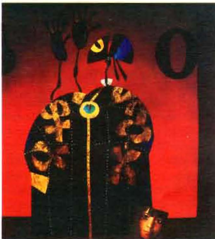
J. Ciuha, Ujetost I , 1975.

V tej številki Biltena objavljamo imena tistih članov, ki so preminili in nas zapustili ali pa se preselili v neki drugi, upamo, boljši svet, kakorkoli kdo od nas to dojenja. Objavljamo imena tistih, o čigar odhodu smo obveščeni. Hkrati vas prosimo, da nas obvestite, če veste še za kakšne člane društva, ki so umrli. Informacija naj vsebuje: ime in priimek, datum in kraj rojstva in smrti.